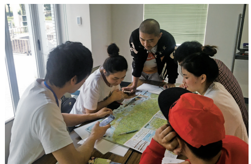
▲日语学习班(西部)的状况

我们随时都在招募日语学习支援义工,欢迎有兴趣的朋友跟我们联络。 (日语学习支援义工指的是坐在学习者旁边,将老师的讲解做辅助说明并 与大家一起练习对话。)