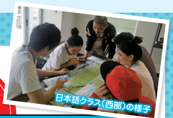
日本語クラス(西部)の様子