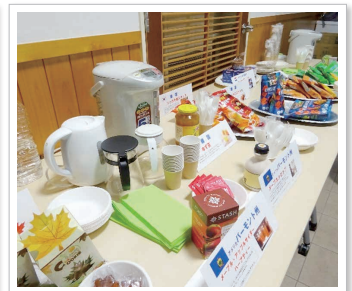
▲派遣地のお菓子を楽しむティーブレイクも好評!