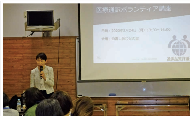
▲講師から基礎知識を学びます

受講者からは「語彙力以上にコミュニケーション能力の大切さがわかった」、「医療従事者・患者目線とも違う、中立的な立場になり、自分の意見を加えない事の大切さを感じた」などの感想が聞かれました。