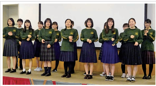
▲バーモント州派遣生徒の手話パフォーマンス