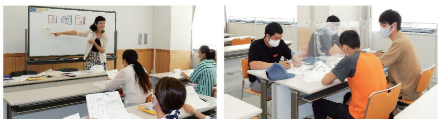
▲A Japanese class (Western region)