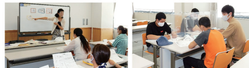
▲Buổi học lớp tiếng Nhật ( Miền Tây )