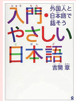
入門やさしい日本語 -外国人と日本語で話そう- (アスク出版) 著者：吉開 章