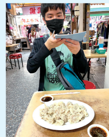
▲インスタグラム映える台湾料理

10日間と短い里帰りでしたが、久しぶりに家族団欒ができて、何より幸せでした。次回は冬休みかな?と今から楽しみにしていきたいと思えます。