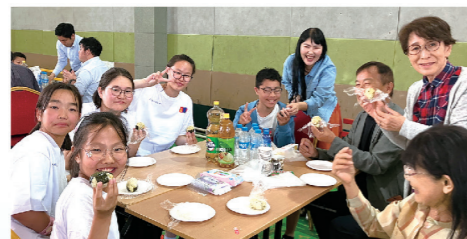
▲日本料理体験おにぎり作り