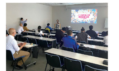
▲2023年春募集説明会の様子

facebook: https://www.facebook.com/jica.tottori/