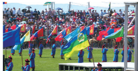
▲モンゴル中央県100周年記念ナードム開会式