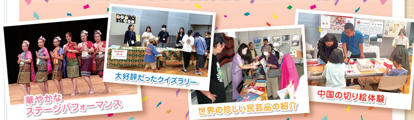
華やかなステージパフォーマンス