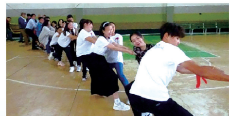
▲綱引き(日本人・モンゴル人混合チーム)

21年前から派遣の翌年には受入をしています。来年は、モンゴルの子供たちを鳥取県に招き、学校への体験入学やホームステイ等で、広く県民の方々との交流を図ることとしています。