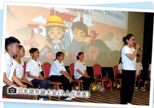
日本語弁論大会(9人が発表)