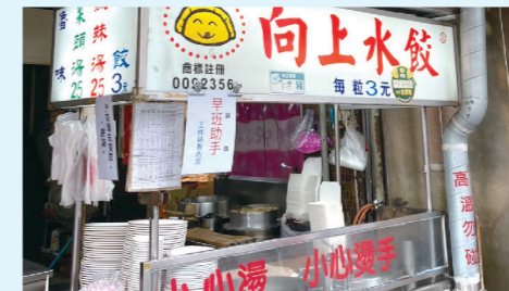
▲台湾の屋台グルメ