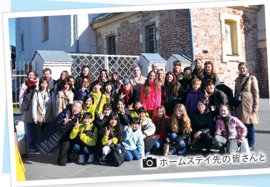
ホームステイ先の皆さんと

お互いを知り、交流によって生まれる人と人との繋がりが、とても温かく、団員の心にも深く刻まれたようです。来年はブルガリアの合唱団を迎え、演奏会を開催します。今後とも国際交流活動を継続していきたいと思えます。