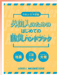
▲防災ハンドブック