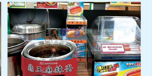
▲「茶葉蛋」(ウーロン茶の味付け玉子)