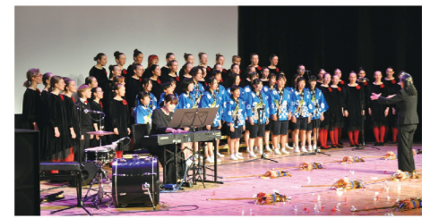
▲現地合唱団との合唱