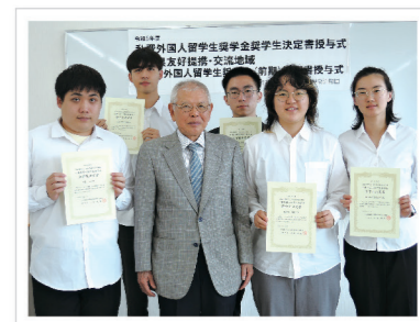
▲公立鳥取環境大学