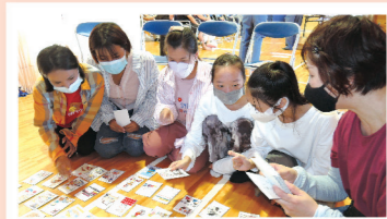
▲かるたで防災の基礎を学びます

やさしい日本語を活用した防災かるたや防災クイズによるゲーム形式で防災の基礎知識を学習しましたが、ゲーム形式のため参加者の理解度は良かったと感じました。