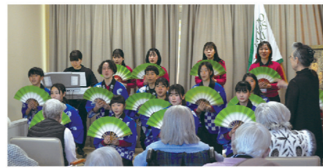
▲ケアホームでのコンサート