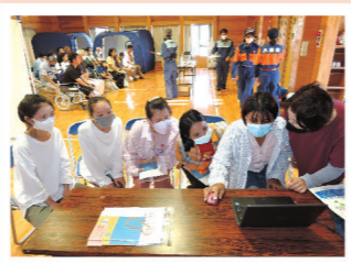
▲みんなで防災クイズに挑戦

去る8月27日(日)には、お盆の台風で大きな被害に見舞われた八頭町で実施された避難訓練に合わせて防災学習を行い、町内の事業所に勤務する外国人実習生(ミャンマー人3名、中国人2名)が参加しました。