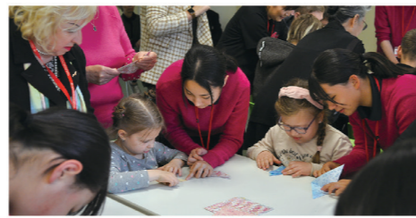
▲リハビリセンターでは折紙で交流