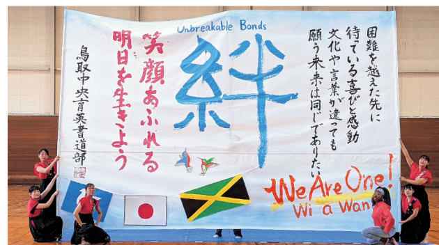
鳥取中央育英高校 書道部の皆さん

異なる国々の、異なる文化や言語の人たちと「バーチャル手紙交換」をおすすめします。鳥取県が未来の世界とつながることに役立つことでしょう。