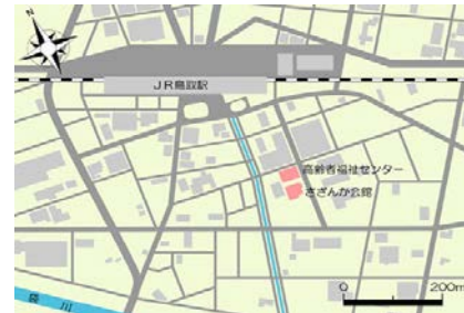
会場図(さざんか会館・高齢者福祉センター)