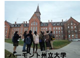
バーモント州立大学