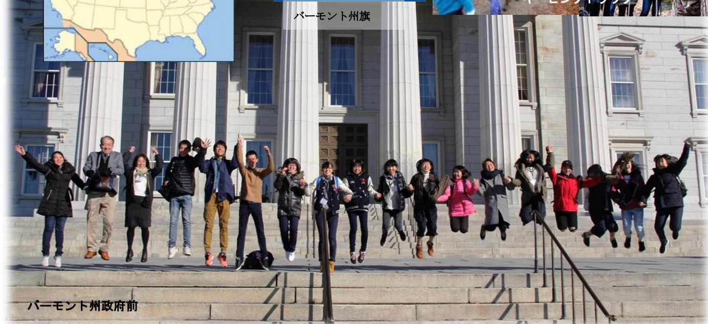
バーモント州政府前